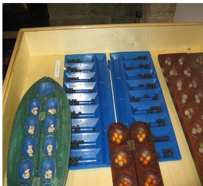
Сурет Тоғызқұмалақ тақташалар түрі